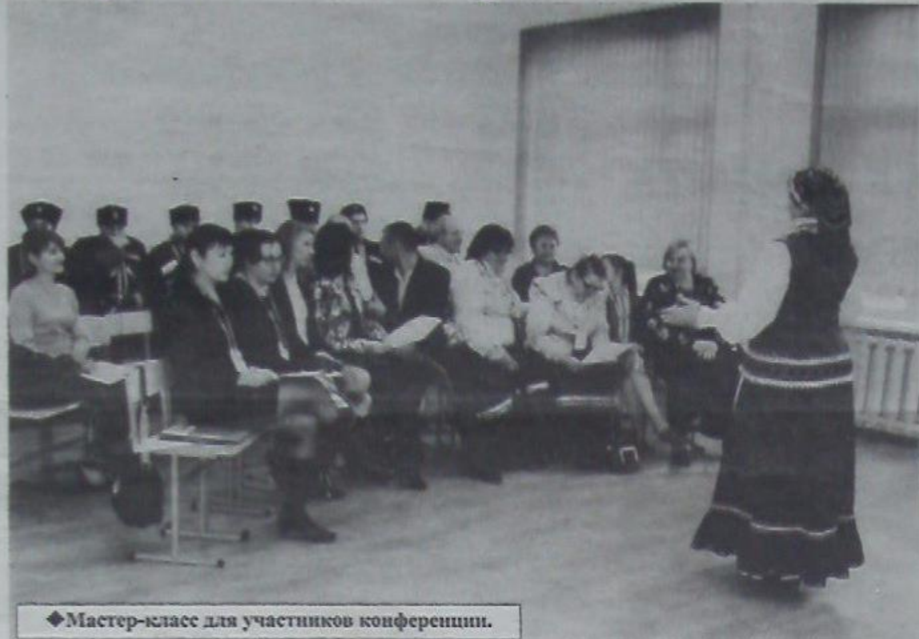
◆ Мастер-класс для участников конференции.